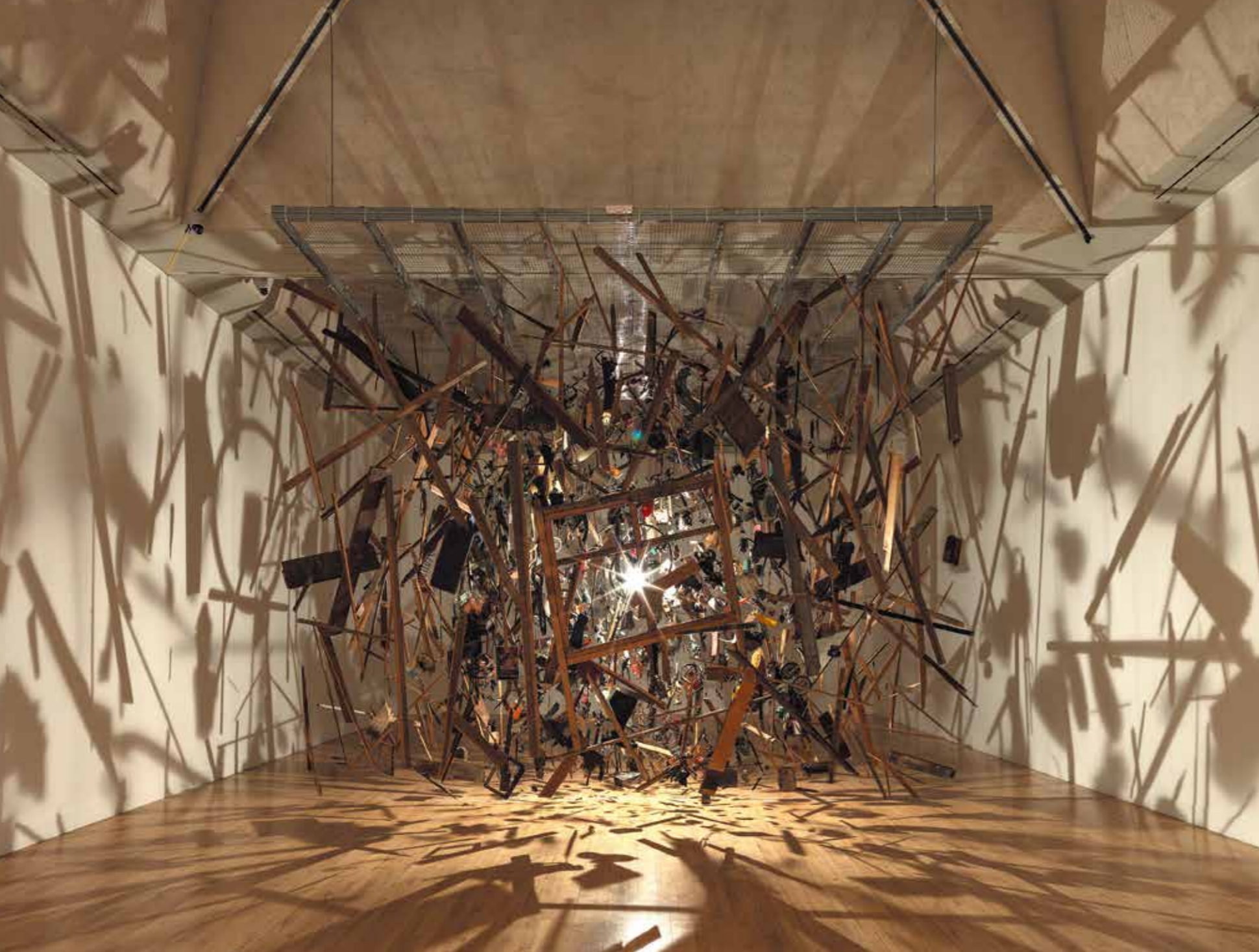
コーネリア・パーカー 《コールド・ダーク・マター：爆発の分解イメージ》1991年